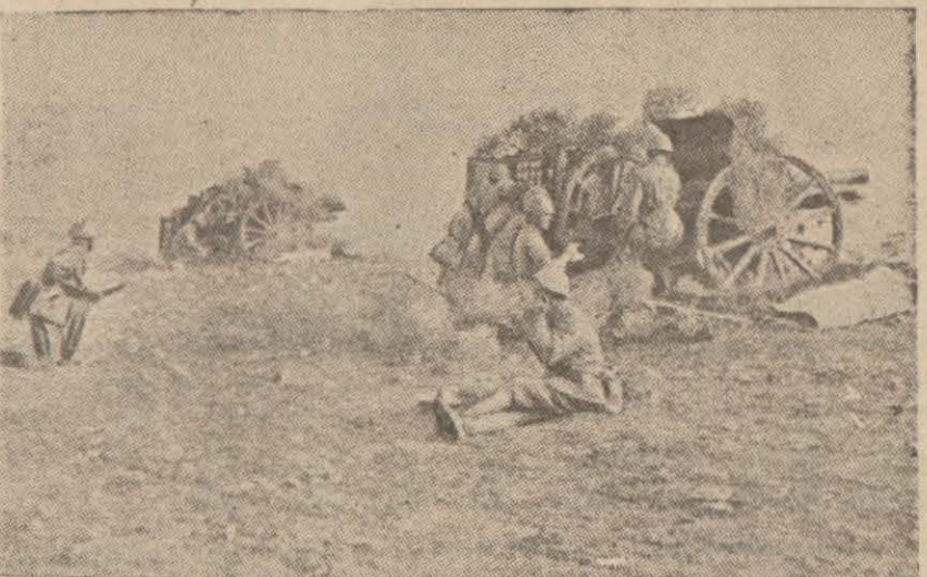
Bir Yunan sahra bataryası

Atina, 29 (A.A.) — Resmî tebliğ: Düşman destroyeri dün Korfu sahilinde birkaç mermi atarak Yunan kıtaatına zarar vermiştir. İngiliz deniz tayaraları Yunanlıların lehine olarak neşredilmiştir.