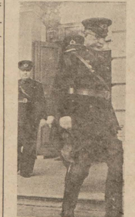
Korgeneral vilâyete girenken

Örfi idare komutanı Korgeneral Ali Rıza Artunkal, dün vilâyete gelerek, vilâyet jandarma kumandanlığında tetkik ve tetkiklerde bulunan sonradan vali muavini Ahmed Kınığı ziyaret etmiştir. Vilâyette bir müddet meşgul olan komutan, müteakiben adliyyeye gitmiş, müddeiumumi Hikmet Onatla görüşmüştür.